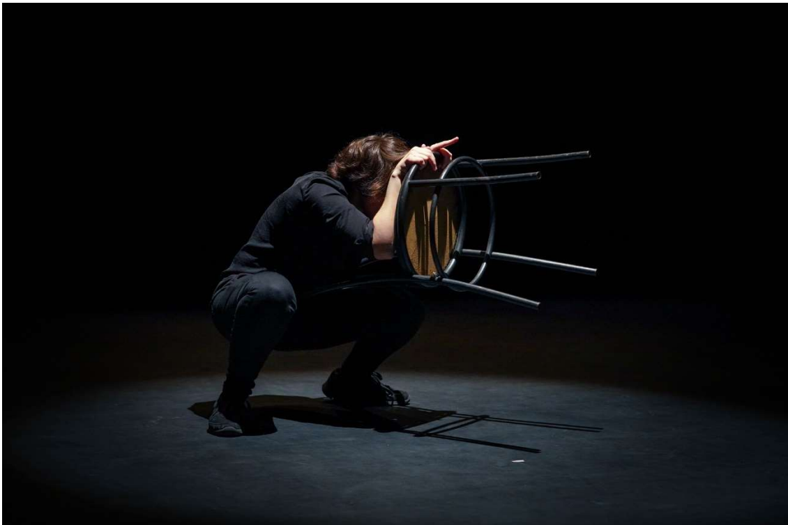
Première représentation en janvier 2020 lors du festival Les 12h de l'impro organisé par la Bulle Carrée

Sans contrainte, sans limite, une seule chose est sûre : elles seront trois !