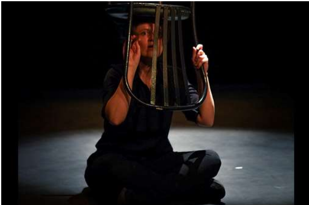
Première représentation en janvier 2020 lors du festival Les 12h de l'impro organisé par la Bulle Carrée

Sans contrainte, sans limite, une seule chose est sûre : elles seront trois !