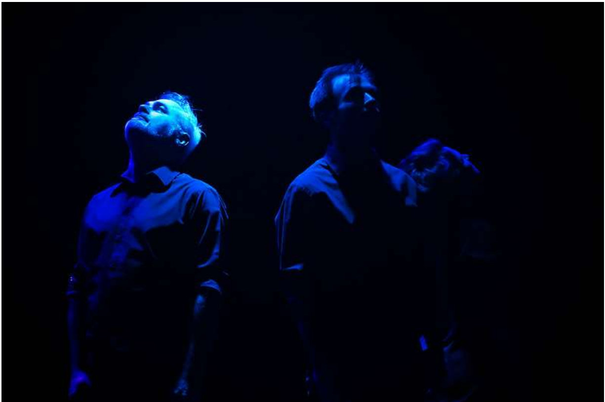
Première représentation en janvier 2020 lors du festival Les 12h de l'impro organisé par la Bulle Carrée

Sans contrainte, sans limite, une seule chose est sûre : elles/ils seront trois !